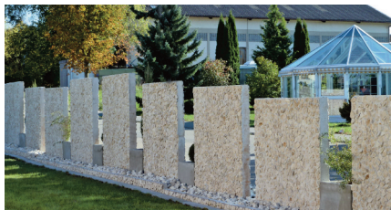
Stelen als Einfassung des Areals mit „Durchblick“