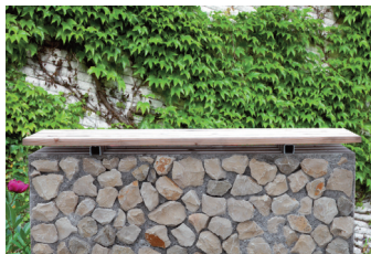
Sitzbank Quader mit Holz-Sitzfläche