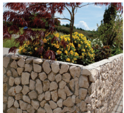
Blumentrog Rechteck oder Quadrat