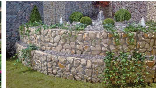
Rundbeet Bepflanzt mit Springbrunnen In Größe und Form variabel