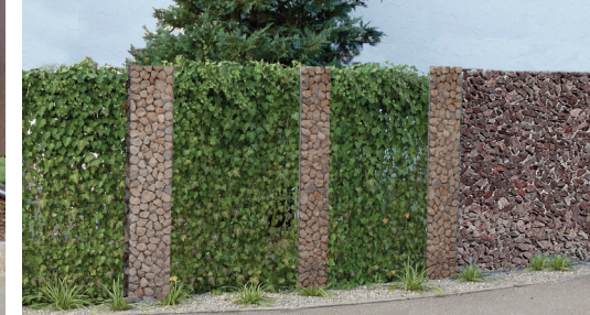
Sichtschutz Breite und schmale Stelen, dekoriert mit Bepflanzung