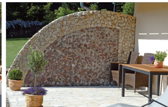
Wind- und Sichtschutzelement Aus zwei Natursteinsorten