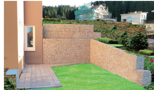
Stützmauer Unterschiedliche Grundstücksebenen perfekt und attraktiv abgestützt