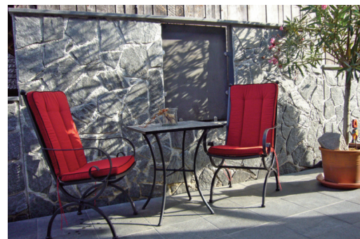
Wandverkleidung In Kombination mit Holz