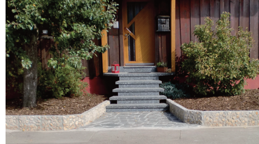
Sockelmauern Neugestaltung im Eingangsbereich